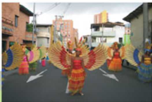
Un gran despliegue de colorido fue el que hicieron las comparsas el día del carnaval, tanto las de las delegaciones de otras ciudades como las de los residentes en Medellín. La delegación de Quibdó mostró lo mejor en trajes de fantasía. En las fotos, comparsas ganadoras en las fiestas de San Pacho 2006.

El aguacero mojó los trajes de fantasía, pero los danzarines y danzarinas supieron lucirlos con garbo hasta la plaza de las esculturas, en donde se remató con chirimía, más baile y música que corrieron por cuenta de las delegaciones.