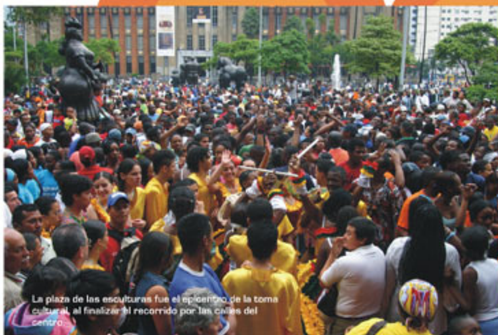
La plaza de las esculturas fue el epicentro de la toma cultural, al finalizar el recorrido por las calles del Centro.

Cada vez más el San Pacho en Medellín halla mayor arraigo entre la gente de la ciudad. Chocoanos y paisas ya saben que para disfrutarlo deben reservar al menos un día de octubre.