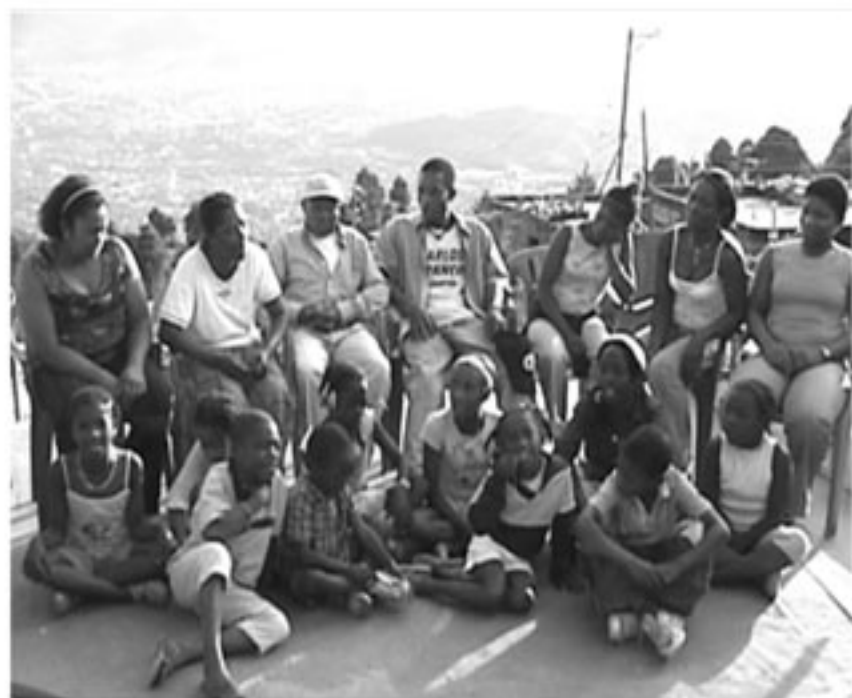
17 barrios de Medellín fueron visitados para la realización del trabajo de campo.

Se espera continuar con la segunda fase del proyecto, ampliando la investigación e iniciando un fuerte proceso de divulgación en toda la ciudad.