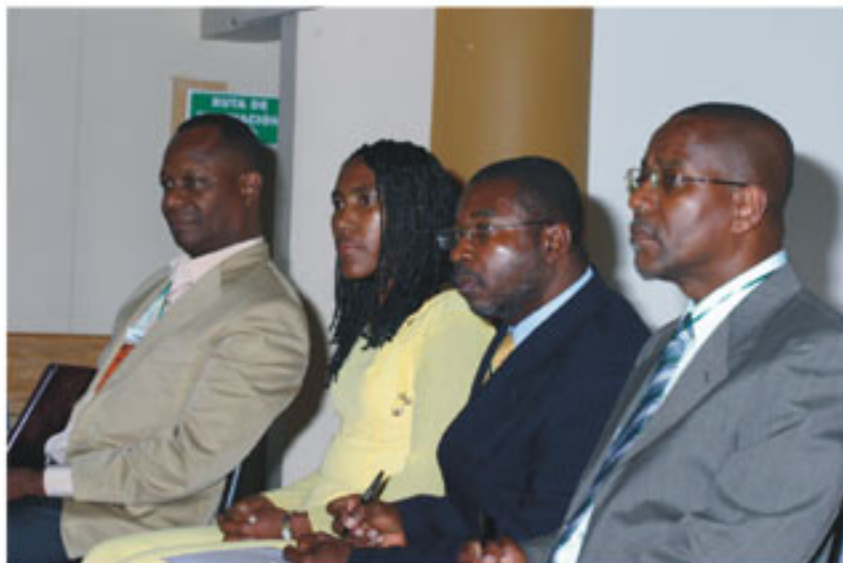
Estudiosos de la etnoeducación presentaron sus visiones sobre el tema al público asistente al Primer Foro Departamental de Educación Multicultural (etnoeducación)

Entre las conclusiones más importantes del foro, está la necesidad de que los educadores de todo el territorio nacional conozcan sobre el verdadero significado de la etnoeducación y no solo que reciban la imposición de la cátedra de estudios afrocolombianos, lo cual ofrecería mejores resultados en relación con la búsqueda de una educación multicultural.