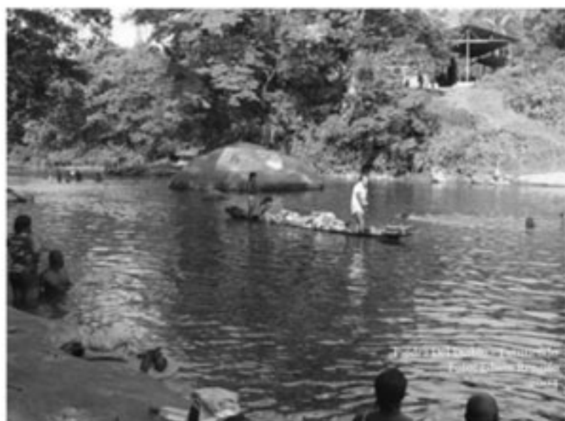
Rio Tutunendo, Quibdó - Chocó

El nombre de Tutunendo se debe al río cuyo nombre en lengua indígena significa TUTUNENDO : Río de Rosas o Fragancia. Podemos pensar que, antes de su fundación, esta zona se encontraba ya habitada por grupos indígenas ubicados en la ribera del río y sus quebradas, y posteriormente, quizás, por algunos negros y blancos dedicados principalmente a la explotación minera.