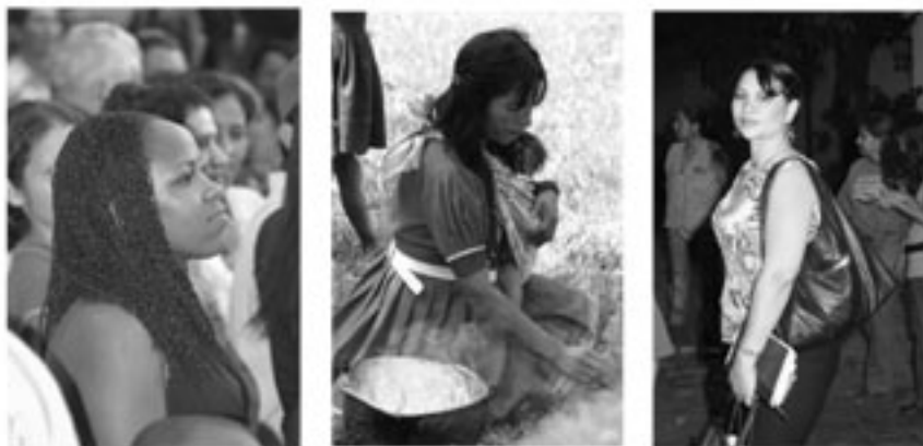
Las mujeres de todas las etnias han sido víctimas de la inequidad

1. Organización, Capacitación y formación de mujeres para su empoderamiento y liderazgo político y social.