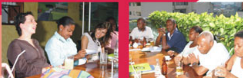
Educadores, representantes de AMICHOCÓ y AICACH participaron de varias reuniones previas a la Siembra de Árboles por la Paz.

sembrados esa tarde son especies de la flora chocoana, los cuales conforman el nuevo Bosque del Chocó. Así aumentaron el número de especies vivas de la colección del Jardín Botánico Joaquín Antonio Uribe. También se trasplantaron 44 árboles y palmeras con los que ya contaban en el Jardín.