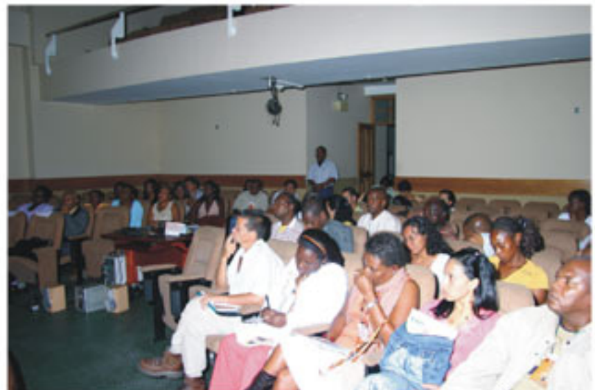
Educadores de distintas instituciones acudieron al Foro.