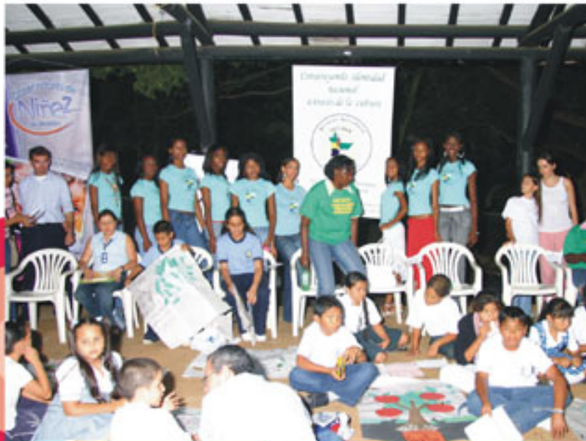
Los niños entregaron experiencias de arte sobre medio ambiente, realizadas en talleres previos en sus colegios, al observatorio de niñez.