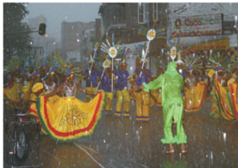
Las comparsas siguieron el recorrido hasta el final. La lluvia no fue excusa para no tomar parte de la fiesta.