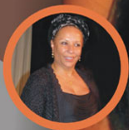
Piedad Córdoba Ruiz Afrocolombiana Ilustre 2006