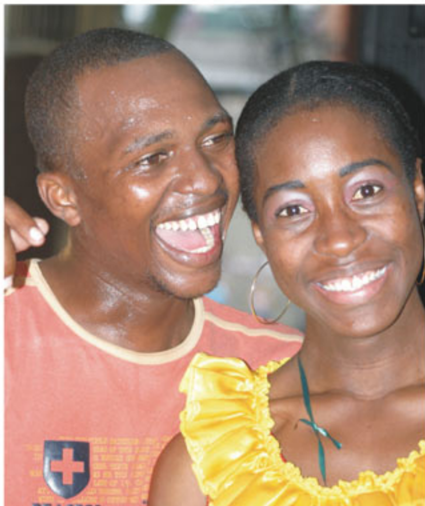
Expresiones de alegría fueron el común denominador.