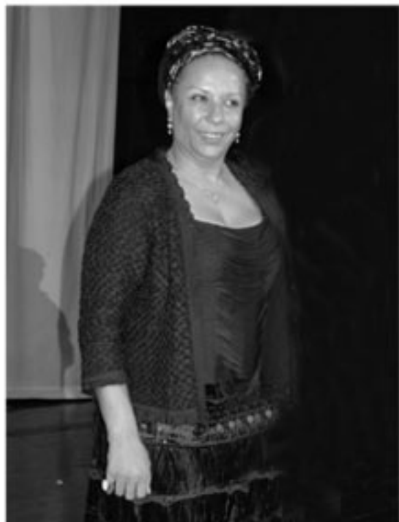
Piedad Córdoba Ruiz, Senadora de la República