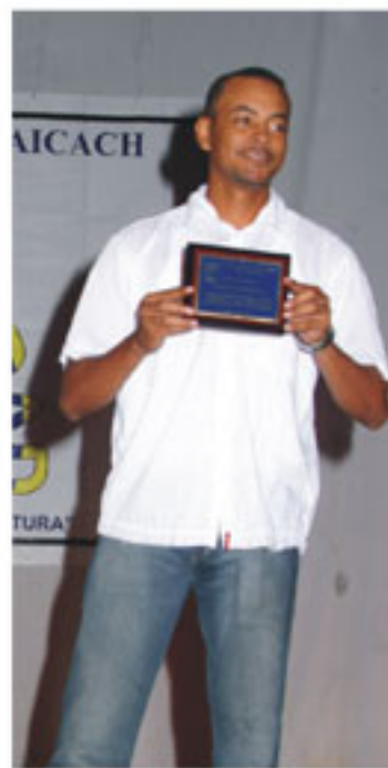
Distribuciones Chocó Ltda recibe distinción por su apoyo al certamen.