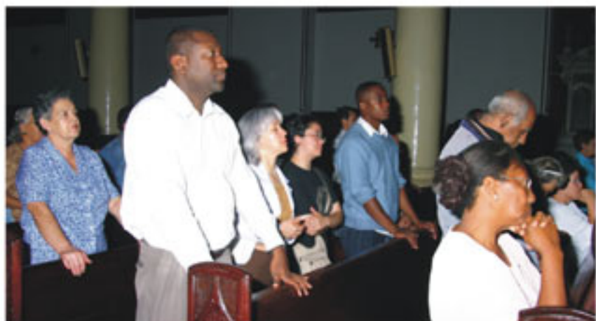
Misa inaugural, iglesia de San Ignacio.

El 4 de octubre, el Octavo encuentro de la Identidad y la Diversidad Cultural comenzó con la misa de consagración a San Francisco de Asís, un manera de pedirle al seráfico su consentimiento para iniciar la celebración. Esto se hace siguiendo la tradición heredada de los devotos quibdosesos, primeros en Colombia en realizar una fiesta en nombre del santo italiano. Al acto litúrgico asistieron educadores, las participantes del Concurso Diosa de Ébano 2006, jóvenes y adultos de la colonia chocoana, a encomendarle al Santo el Encuentro de este año.