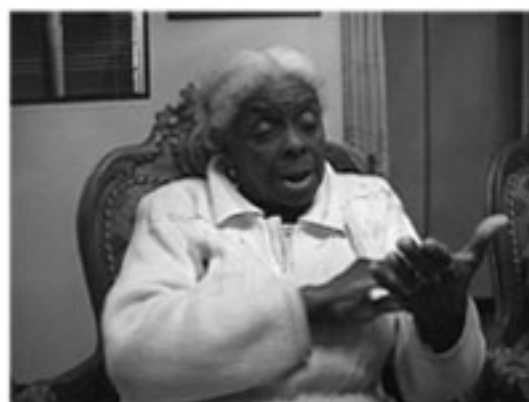
Con la investigación, se logró sacar esa tradición oral que hace parte de la vida de los abuelos

El 27 de enero de 2006, luego de haber sido elegido el proyecto en una convocatoria más de la Secretaría de Cultura Ciudadana del Municipio de Medellín, se firmó la realización de la investigación rescate de la tradición oral afrocolombiana en la ciudad de Medellín, a efectuarse por la Asociación Intercultural Antioquia Chocó y la Fundación Somos, en una unión temporal para cumplir el objeto del contrato y, más allá de ello, los objetivos del proyecto, juntando las fortalezas de cada una de estas instituciones en el trabajo social y académico.