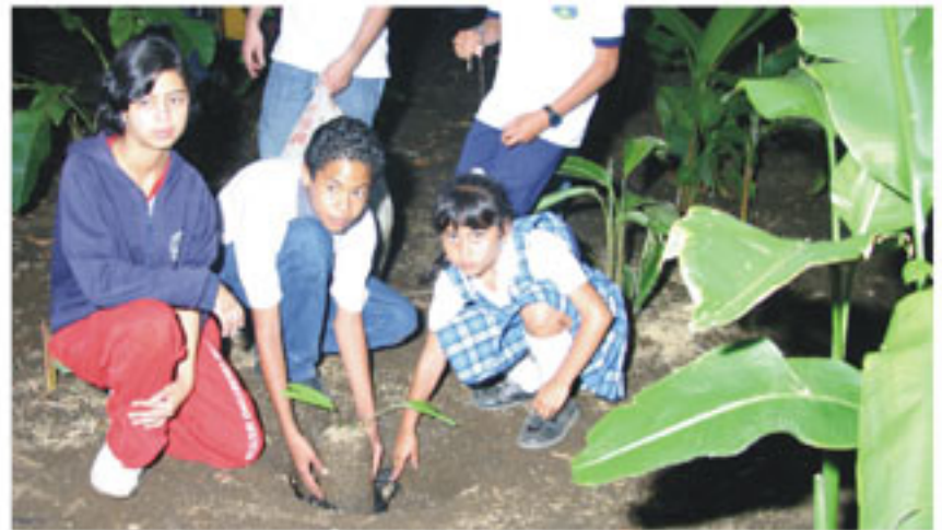
"Del Chocó un rincón verde para Antioquia". Los niños fueron los encargados de sembrar los nuevos árboles del bosque del Chocó en el Jardín Botánico.