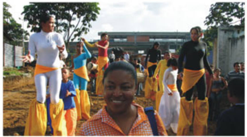
El grupo "Combos" amenizó la jornada

La jornada estuvo encabezada por autoridades ambientales de la ciudad, organizaciones que trabajan temas relacionados con el medio ambiente, representantes de los colegios y los medios de comunicación. No era para menos, los arbolitos