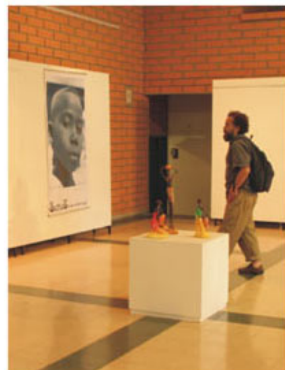
Exposición de fotografías. Universidad de Antioquia