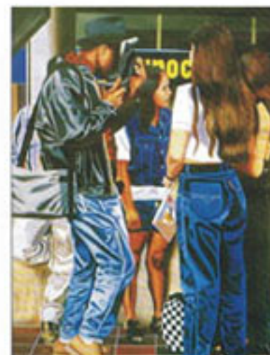
Obra de Severando Palacios Aquí gozándonos este cuento | Técnica: Óleo sobre lienzo

Con el cartón de bachiller bajo el brazo decidió viajar al municipio de Riosucio donde se desempeñó como Profesor de español y geografía. Luego se trasladó a Apartadó (Antioquia) donde entró en contacto con nuevos amigos. Así llegaron los libros, el blues, el jazz y otros conocimientos sobre pintura que le permitieron explorar en otro mundo. Incursionó en el surrealismo criollo, un estilo pictórico que, a través del