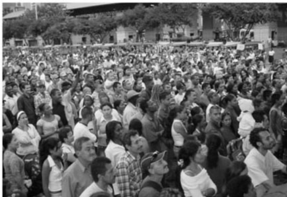
Evento cultural realizado en el Parque San Antonio, Medellín