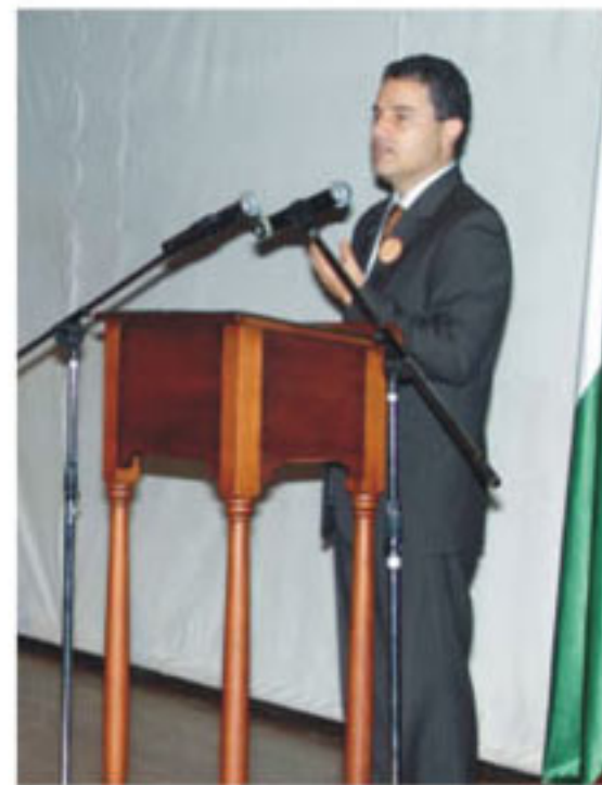
Anibal Gaviria Correa, Gobernador de Antioquia

Hoy, los afrocolombianos representan el 26,83% de la población, con cerca de 12 millones distribuidos en el 47,5 del territorio, quienes luchan por la igualdad y la no discriminación. Según datos del Dane, Conpes y Plan de Desarrollo de Comunidades Negras, su situación sigue siendo dramática, pues todavía hay formas de discriminación que se reflejan en sus indicadores socioeconómicos,