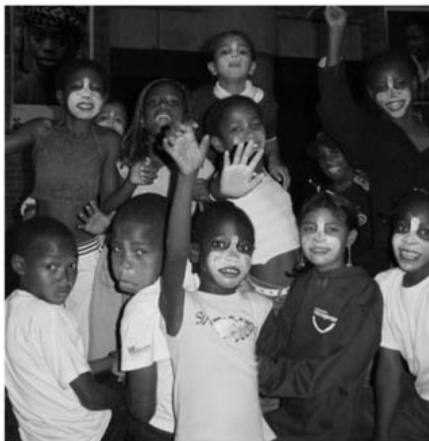
Registro de manifestación cultural vigente en Medellín

Para la realización del SIC, Se conformó un grupo interdisciplinario y se definieron las fases y actividades metodológicas para el logro de los objetivos y el cumplimiento cabal del proyecto.