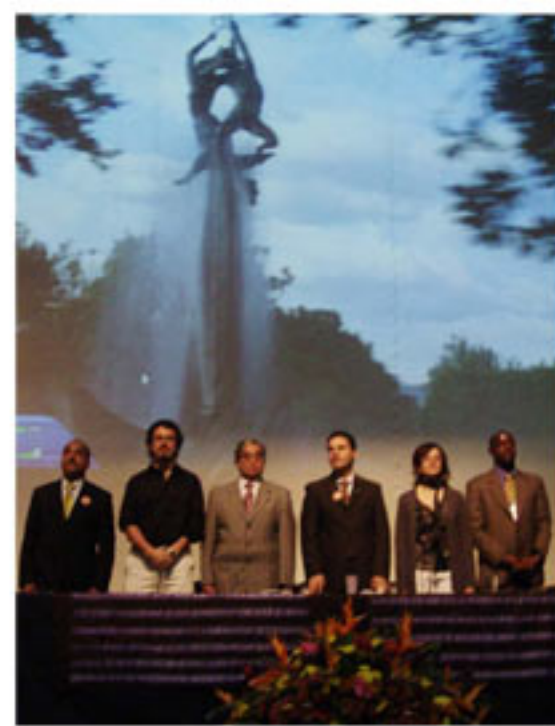
Mesa principal instalación Foro : Compromiso de la educación superior con las problemáticas afrocolombianas