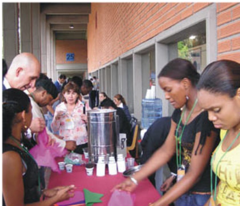
Degustación de la gastronomía afrocolombiana, salida teatro Camilo Torres

“Los afros están de moda. Actualmente en la universidad se esta constituyendo un grupo llamado el colectivo de estudiantes afro, quienes en el transcurso de la semana han realizado una serie de actividades y hoy en el marco de la celebración del la semana de la afrocolombianidad este grupo se presentará oficialmente ante la comunidad”.