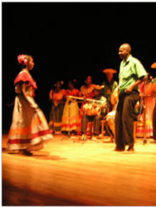
Presentación en el teatro Camilo Torres del Bullerengue de San Juan de Urabá