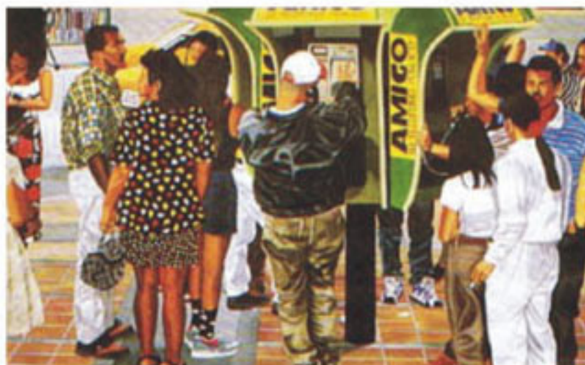
El rebusque alrededor del Parque de Berrío | Técnica: Óleo sobre lienzo

Sus exposiciones han recorrido las principales salas y galerías de arte del país. Este reconocimiento le ha servido para ser invitado a diversas competiciones internacionales, una de ellas a la exhibición de obras, en la Galería Montserrat de la ciudad de New York.