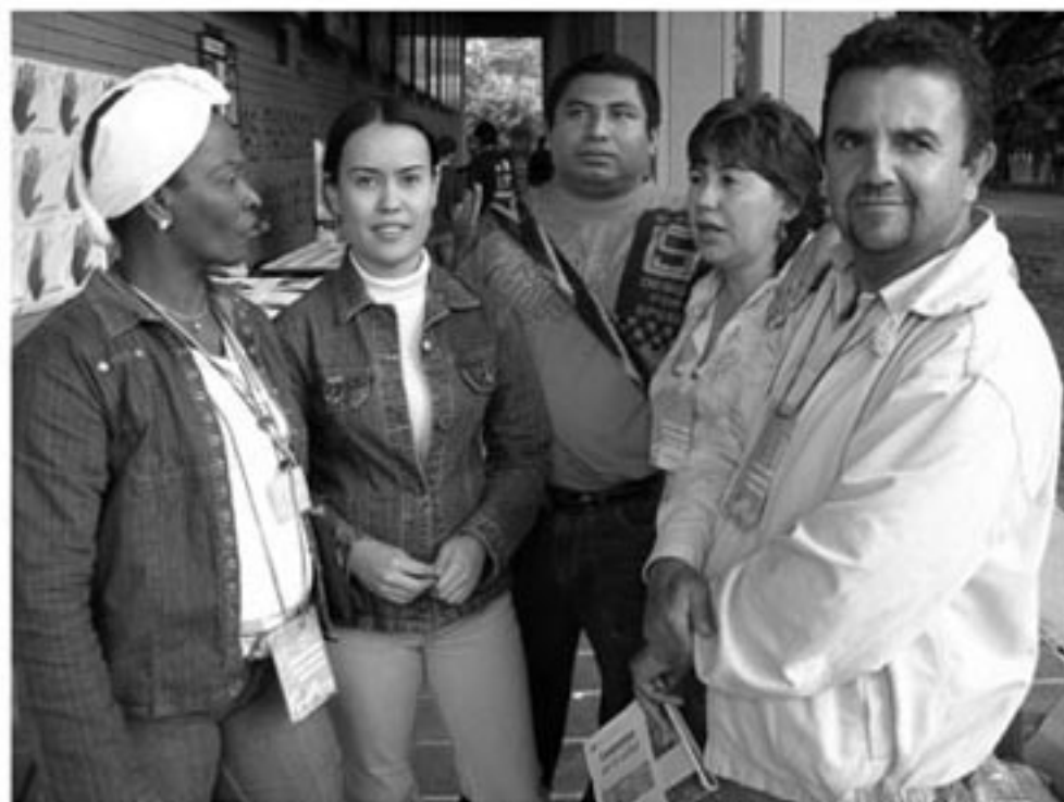
Funcionarios de la Secretaría de Cultura Ciudadana de Medellín. Día de la Afrocolombianidad, 2006