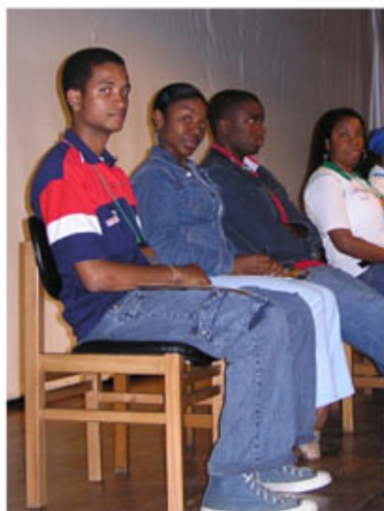
Jóvenes estudiantes de la Universidad de Antioquia y del Politécnico Jaime Isaza Cadavid