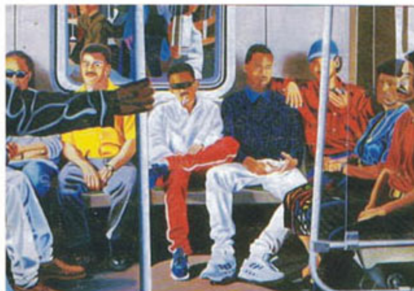
El Metro parcero | Técnica: Óleo sobre lienzo