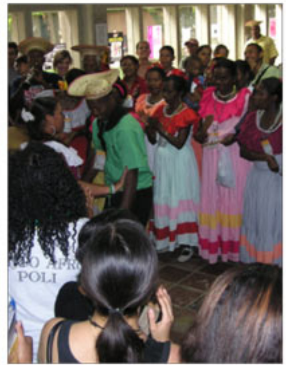
Presentación del Bullerengue de Necoclí y El Sainete de Girardota

como el de necesidades básicas insatisfechas INB, que supera el 80%, pobreza extrema del 76%, ingreso per cápita tres veces por debajo del promedio nacional.